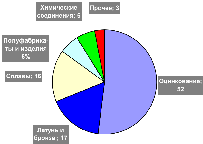
Рисунок 4: Структура «первичного» потребления цинка в мире, %