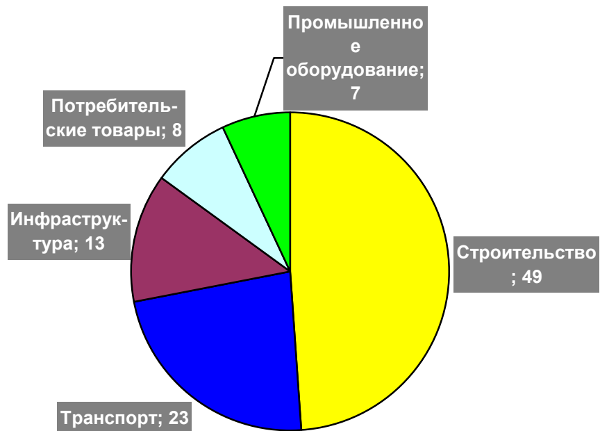
Рисунок 5: Структура «конечного» потребления цинка в мире, %